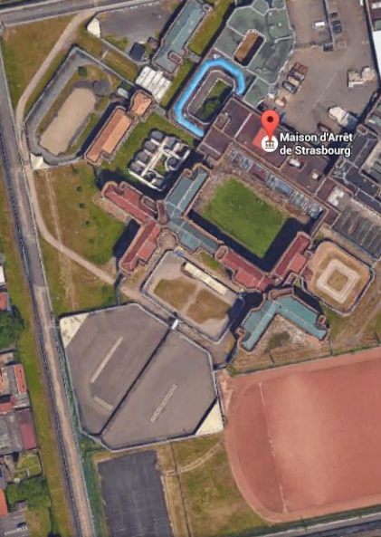
Maison d'Arrêt de Strasbourg